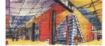
Lycée PAUL EMILE VICTOR